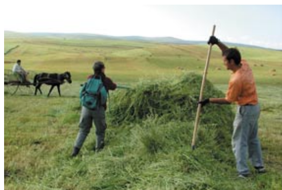
Descriptif du séjour sur www.tamdi.org