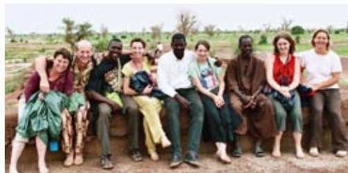
A Sofara - Circuit Fleuves et Brousse - Aout 2006