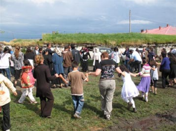
Fête au village de Bogatepe.