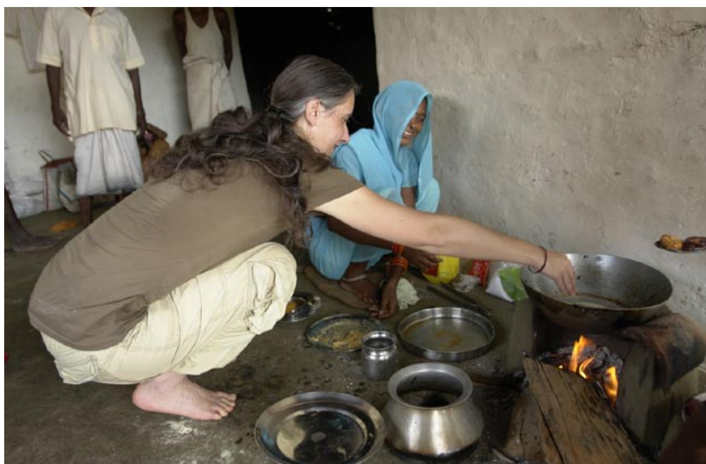
Au village, dans la cuisine de la famille, cours de chapati

Nourriture : sujet complexe puisque trois d'entre nous ont été malades et avaient l'estomac délicat pendant la suite du séjour. Nous n'avons pas toujours fait honneur aux repas qui nous