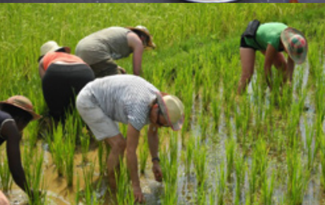
Repiquage du riz à Madagascar