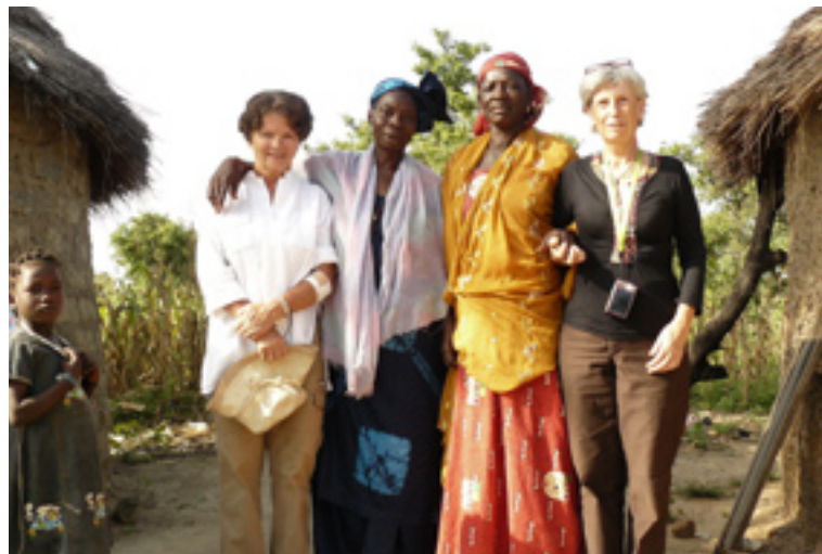
Au campement des femmes de Bougouni