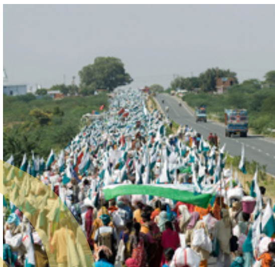
Janadesh en 2007