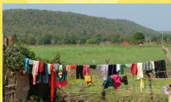
Village vers Bophal