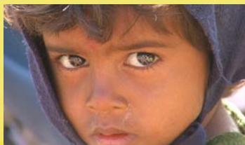
Village vers Katni